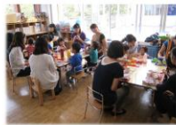
親子で昼食(コロナ禍前)

秋以降にはお弁当も始まります。まずは好きなものをお弁当に入れていただき、自分の力で食べられて、そしてできるだけ残さないように感謝していただきます。