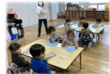
秋・冬：子どものみ登園