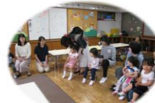
春・夏：親子一緒に通園