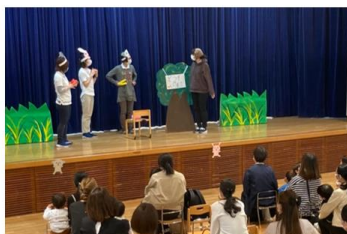
春 オリエンテーション