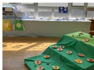
3月 がんばりましたの会