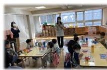
子どもだけでお弁当